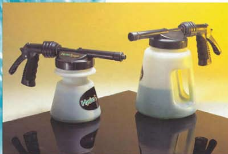
Modelos 483 y 481

Cuando el HydroFoamer y el HydroSprayer se utilicen en combinación (ver el reverso de esta hoja), se consigue un sistema total, que permite la limpieza, el enjuague y el saneamiento.